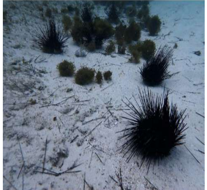
2. individualnan cu a los, yegando den e areanan di santo, unda nan ta saca nan spinanan